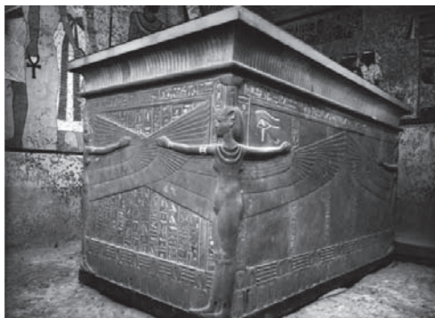
Sarcòfag en quarsita que es trobada dins de les capelles en fusta daurada