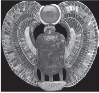
Pectoral realitzat en pedres semiprecioses i or