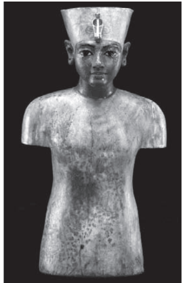
Bust del faraó Tutankhamon. Fusta policromada