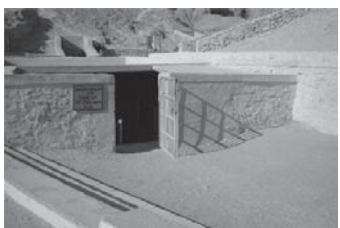
Entrada a la tomba del faraó Tutankhamon (KV62). Vall dels Reis

acabar esdevenint un gran coneixedor de tota aquesta zona fins al punt que, a partir de l'any 1900 s'interessa obertament per la Vall dels Reis, situada darrere del temple on havia estat treballant. I és just en aquest moment que és nomenat director general dels Monuments de l'Alt Egipte. Tres anys més tard seria traslladat a la zona nord del país, el Baix Egipte, on desenvoluparia la mateixa tasca.