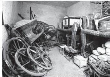
Aspecte que presentava l'avantcambra de la tomba en el moment del seu descobriment