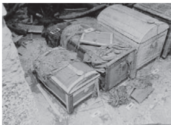
Cofres descoberts dins de l'anomenada cambra del tresor