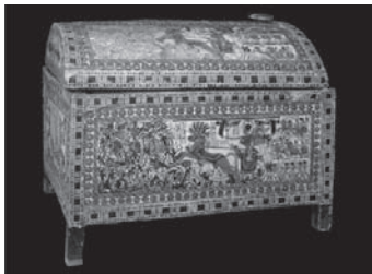
Cofre en fusta policromada on el faraó derrotà als enemics d'Egipte