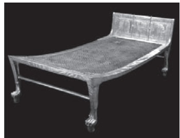
Llit en fusta daurada descobert dins l'avantcambra