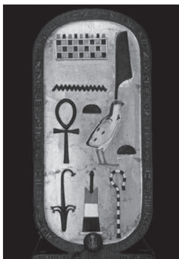
Tapadora d'una de les caixes descobertes dins la tomba i que presenta la forma d'un cartutx amb el nom del rei

la intenció de lord Carnarvon, secundada, en bona part, per Howard Carter. És també el resultat de l'esforç i la perseverança.