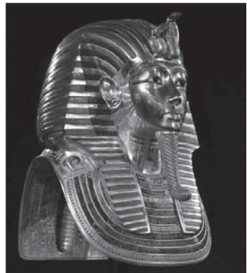
Màscara funerària del jove faraó confeccionada en or