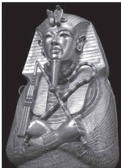
Sarcòfag en or massís de Tutankhamon