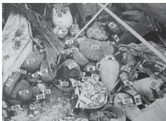
Disposició dels objectes dins l'annex. Les cistelles contenien aliments