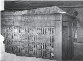
Primera capella en fusta daurada. Cambra funerària de la tomba de Tutankhamon