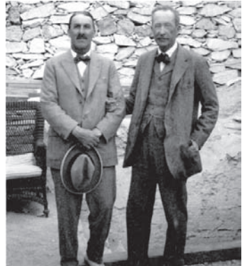
Howard Carter i Lord Carnarvon l'any 1923

L'endemà es va procedir a netejar els setze esglaons fins a la primera entrada tapiada. Un cop oberta, un passadís permetia l'accés fins a una segona porta tapiada que també presentava el nom del faraó dins d'un cartutx, així com el segell de la necròpolis reial constituït per la representació d'un xacal acompanyat per nou captius distribuïts en tres fileres. Tot seguit, es va practicar un forat a la part superior esquerra d'aquesta segona porta per poder veure què hi havia dins. Amb l'ajuda d'una espelma com a única il·luminació, Howard Carter va introduir-la per aquest orifici amb la finalitat de poder veure què hi havia a dins. L'espectacle que va oferir resultà sorprenent. Un munt d'elements es trobaven dipositats i amuntegats dins d'una cambra rectangular anomenada avantcambra. Diferents llits, tamborets, carros desmuntats, caixes plenes d'objectes, mobiliari variat i estatuetes, entre d'altres, constituïen tot un univers de formes variades. Explorada aquesta primera habitació i després d'haver-ne extret el contingut, es va poder accedir a un segon espai que presentava